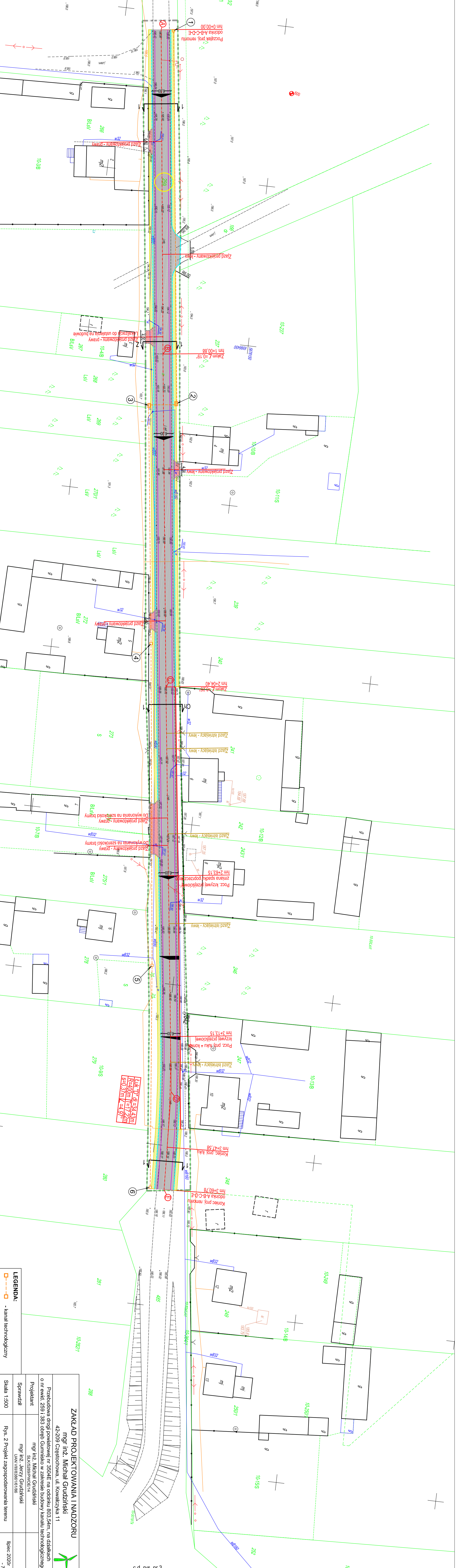
c.d. rys. nr 3